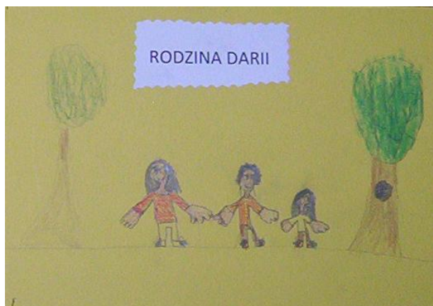
Daria z babcią lubi chodzić na długie spacery.