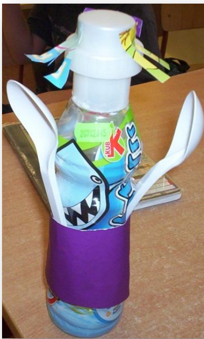
Lalka Bianki Gawdzziel