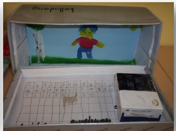
Komputer Bartosza Rachwała