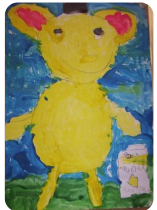
Zaczarowane misie namalowane przez uczniów.